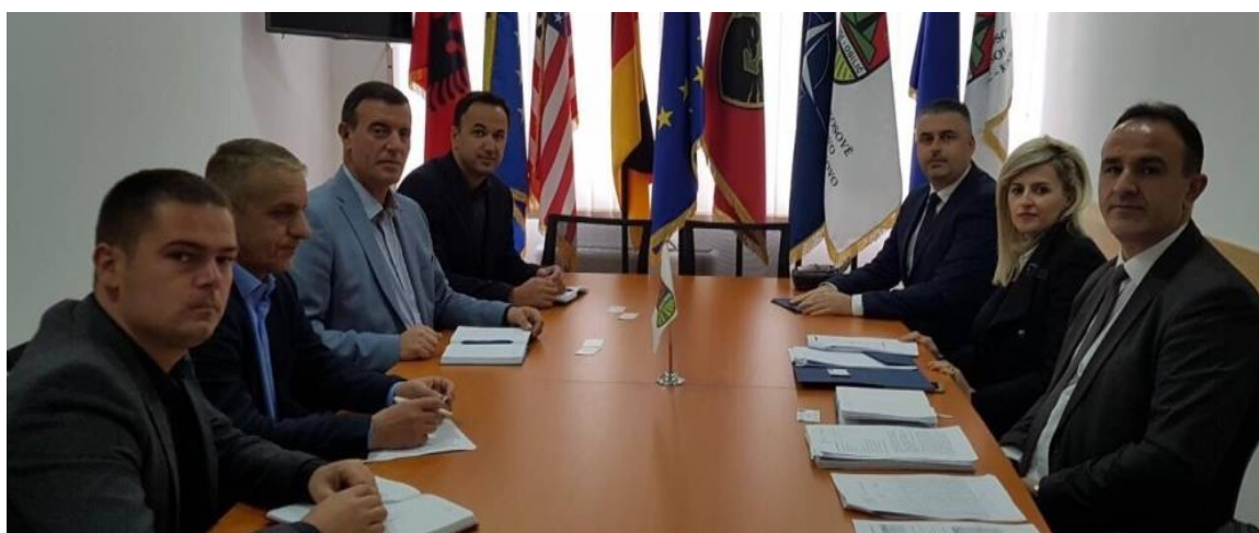
Fotografia 9. Takimi me Udhëheqjen e Komunës së Obiliqit