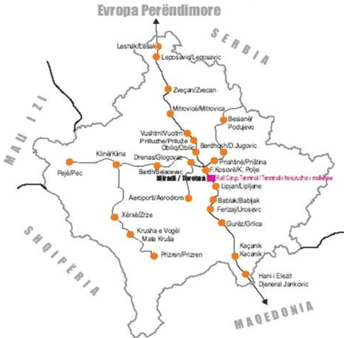
Fotografia10. Harta e Hekurudhave në Republikën e Kosovës