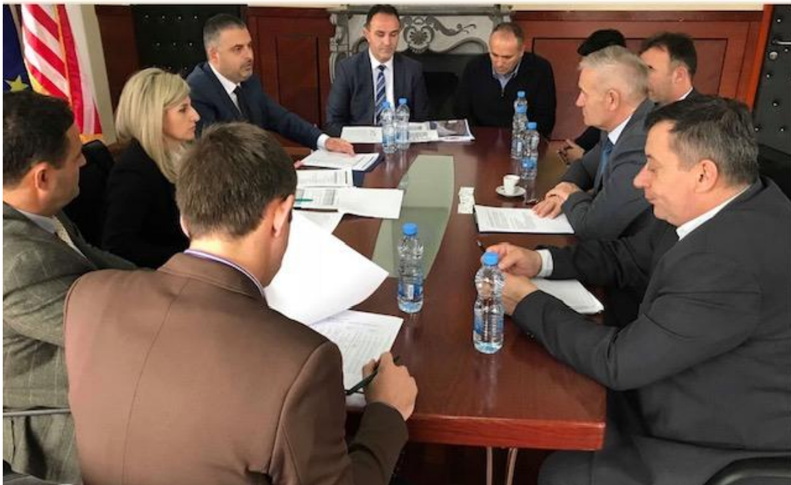
Fotografia 6. Takimi me Udhëheqjen e Komunës së Klinës

Realizimi i këtij projekti ka ndikuar në krijimin e një praktike të re të bashkëpunimit ndërinstytucional, e cila ka ndikuar në nxitjen e planifikimit të aktiviteteve tjera të përbashkëta në të ardhmen, me qëllim të rritjes së nivelit të sigurisë që do të ndikonte në parandalimin e aksidenteve hekurudhore.