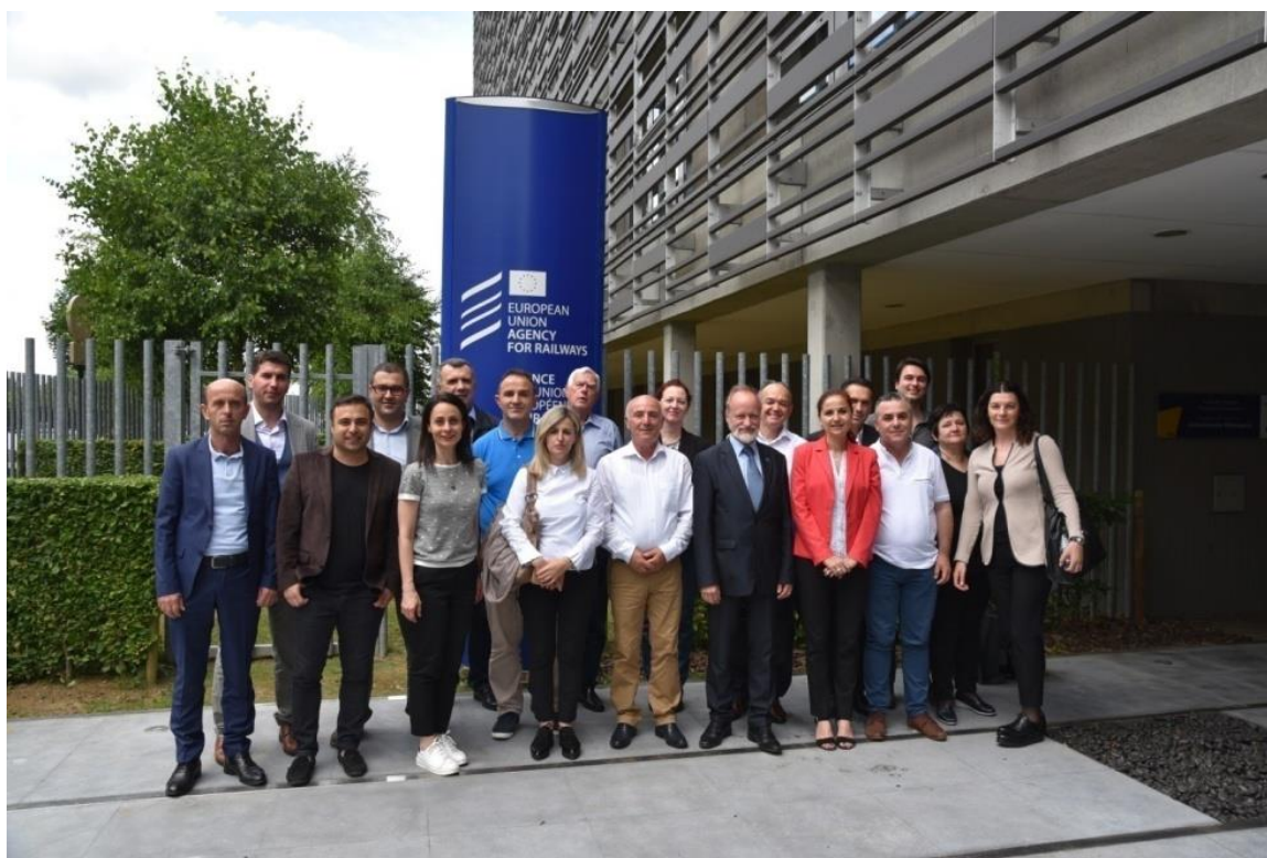
Fotografia 1. Takimi 48 të Plenarë të Rrjetit të Autoriteteve Kombëtare të Sigurisë