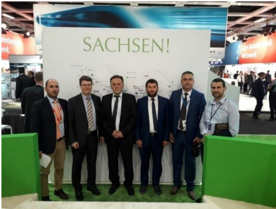
Fotografia 3. Pjesëmarrja në Inotrans 2018