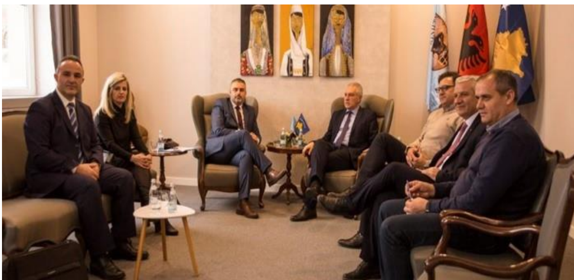
Fotografia 7. Takimi me Udhëheqjen e Komunës së Prishtinës

Realizimi i këtij projekti ka ndikuar në krijimin e një praktike të re të bashkëpunimit ndërinstytucional, e cila ka ndikuar në nxitjen e planifikimit të aktiviteteve tjera të përbashkëta në të ardhmen, me qëllim të rritjes së nivelit të sigurisë që do të ndikonte në parandalimin e aksidenteve hekurudhore.