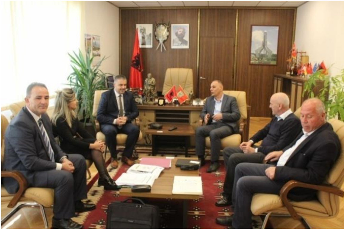
Fotografia 5. Takimi me Udhëheqjen e Komunës së Hanit të Elezit

Përmes këtyre takimeve është synuar që fillimisht të arrihet një bashkëpunim në mes të ARH-së dhe këtyre komunave, i munguar deri me tani, si dhe sqarimi i detyrave dhe përgjegjësive të Komunave përkatëse në raport me Ligjin për Hekurudha. Kjo iniciativë është mirëpritur dhe vlerësuar lartë nga autoritetet komunale, duke ofruar gatishmërinë e plotë për bashkëpunim me ARH-në me qëllim të ngritjes së nivelit të sigurisë hekurudhore.