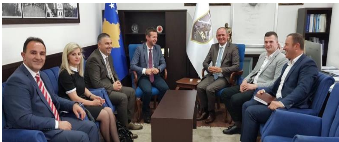
Fotografia 8. Takimi me Udhëheqjen e Komunës së Ferizajtit

Në aspektin e sigurisë, gjatë këtyre takimeve, diskutime kishte posaçërisht për përgjegjësitë ligjore (Ligji për Hekurudhat) si dhe sqarimin e këtyre përgjegjësive në mes të Ministrisë, komunave, Menaxherit të Infrastrukturës dhe akterëve tjerë. Në kuadër të kësaj, me theks të veçantë është diskutuar çështja e vendkalimeve hekurudhore, legale dhe ilegale, sinjalizimi, aksidentet hekurudhore, pastrimi i brezit hekurudhor etj. Siç u theksua edhe më lartë, këto takime janë realizuar në komunat nëpër të cilat shtrihet linja hekurudhore, që përfshinë komunat: Hani i Elezit, Kaçanik, Ferizaj, Lipjan Fushë Kosovë, Prishtinë, Obiliq, Drenas, Klinë dhe Pejë.