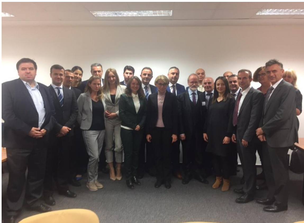
Fotografia 2. Punëtorja me vendet e IPA-së

në vendet e tyre. Pas diskutimeve ndërmjet përfaqësuesve të ERA-s, Komisionit Evropian, SEETO-s dhe vendeve të IPA-s si konkludim doli se duhet të bëhen më shumë përpjekje për të filluar me krijimin e grupit punues i cili do të merrej me reduktimin e rregullave nacionale të sigurisë në vendet e IPA-s, nën monitorimin e ERA-s.